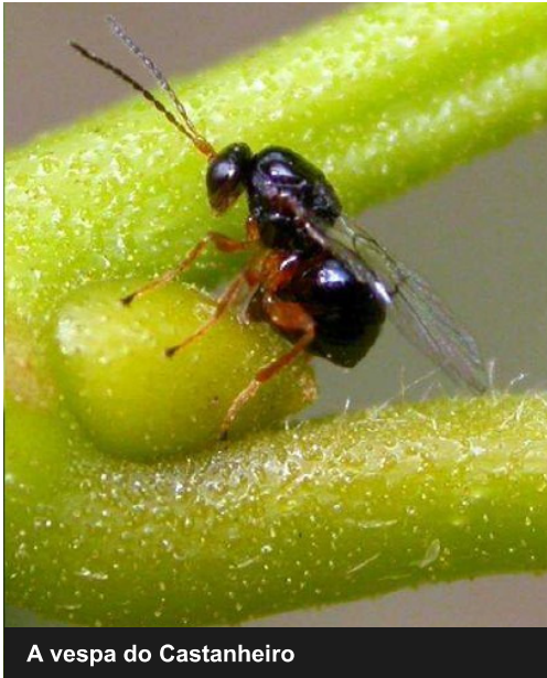
A vespa do Castanheiro

Um adulto prestes a picar novo gomo para depositar no seu interior os ovos (julho - agosto).